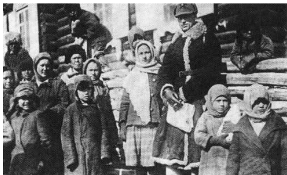
Константин Рокоссовский Байгалай хизаарта, 1931 он