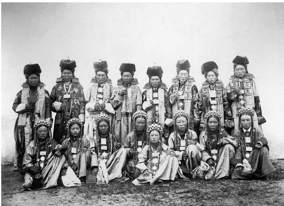
Сэлэнгын дүүмын мэдэлэй буряад бүхэгүйшүүл