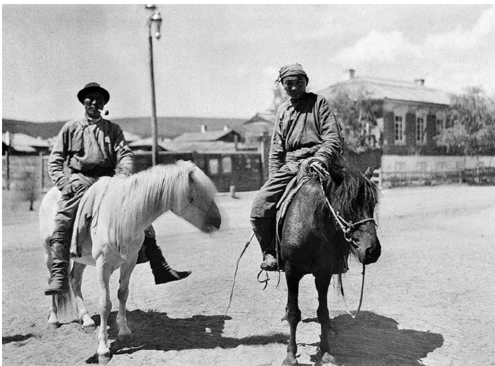
Мори унаһан хоёр буряад хүн, 1913 он