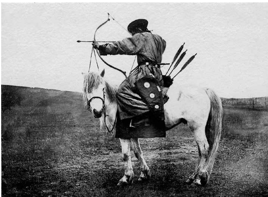
Номо дэлихэн моритой хүн