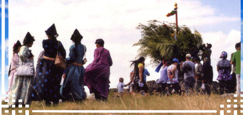
Буряадай бөөнэр, удагад