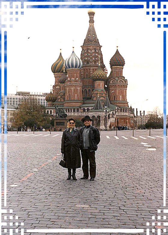
Наһанай хани Аюулгүйтээ 1989 ондо Москва хотодо, Улаан талмай .