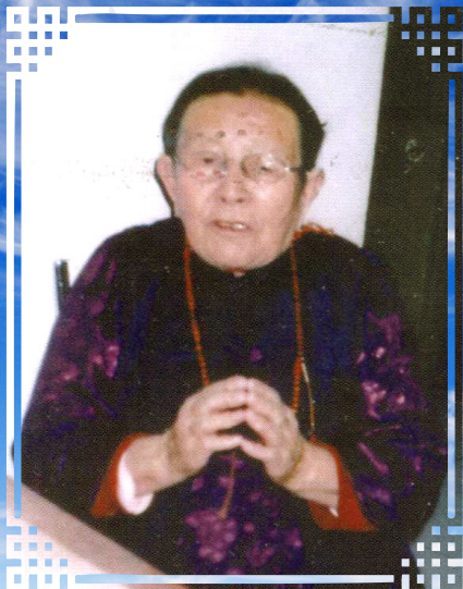
Буряад арадай дуушан Хандама. Шэнэхээн