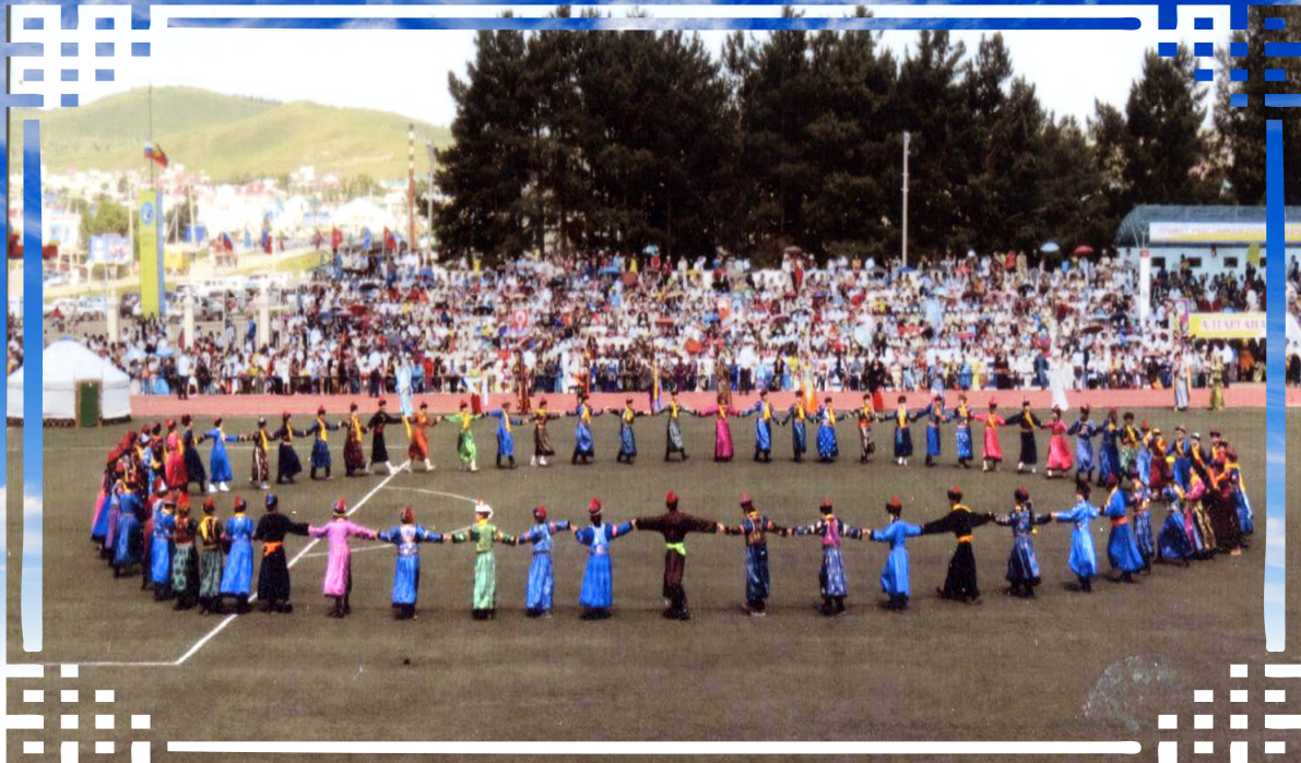
Ёохор хатар “Алтаргана” наадам дээрэ. Агын тойрог