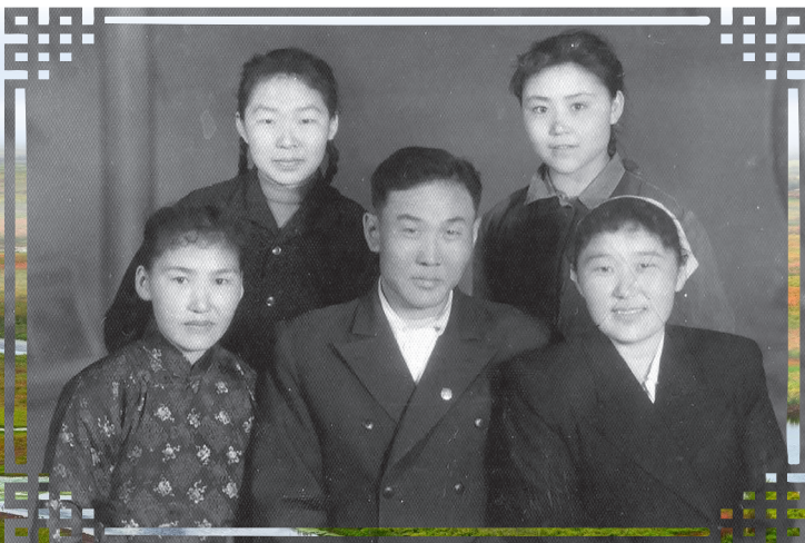
Нүхэдтээ хамта, 1962 ондо Хайлаарта