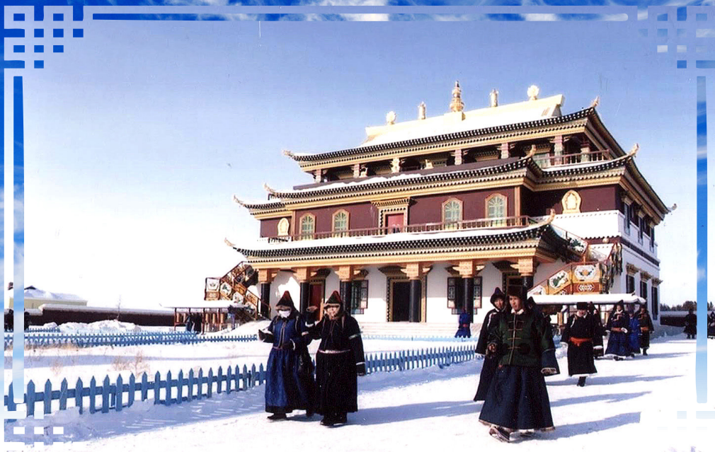
Шэнэхээн сүмнн үбэлэй Зула хуралай үсын мүргэлшэд