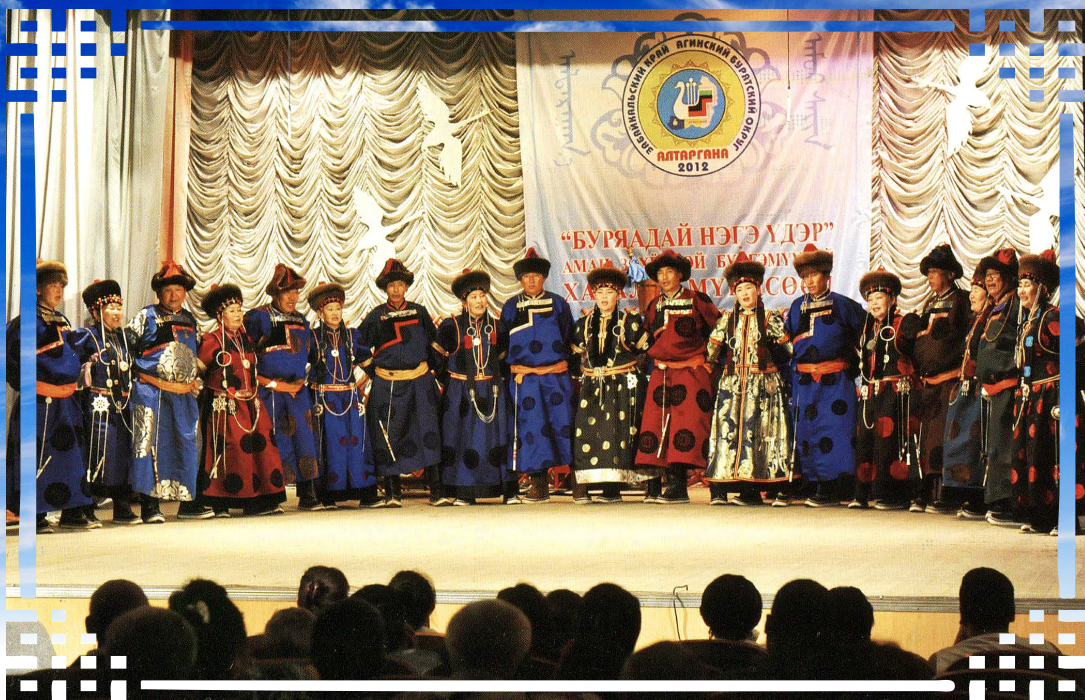
Арадай урлигшад “Нэрьеэнэй дуу” дуулжа байна