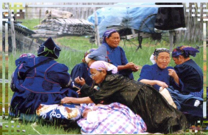
Буряад арадай уран оёдолшод. Хурим найрта хубсаһа хунар, шэнэ гэрэй оёдол оёжо байна