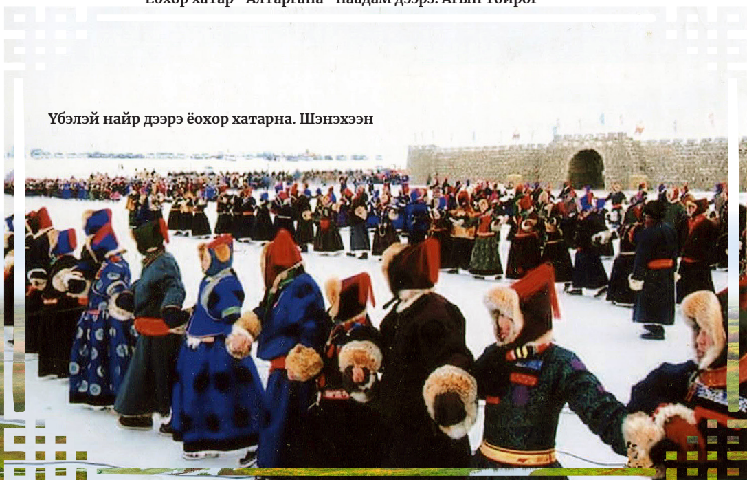
Үбэлэй найр дээрэ ёохор хатарна. Шэнэхээн