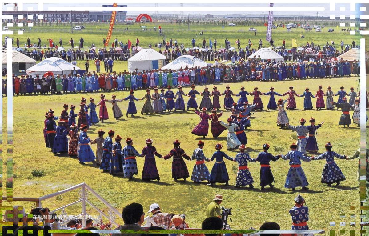
Зунай найр наадам