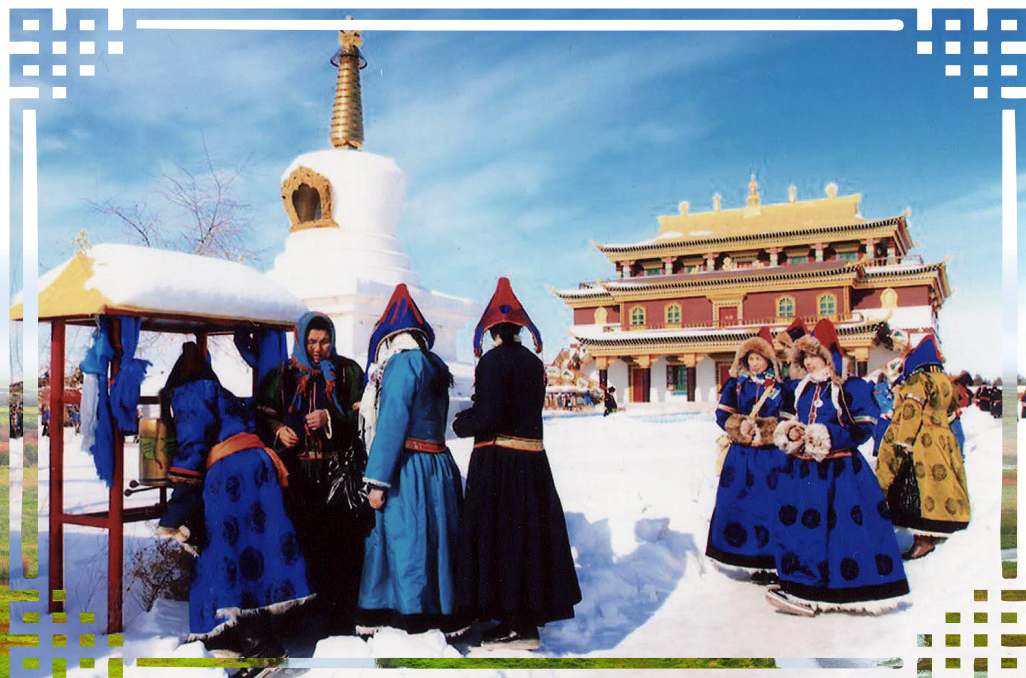
Хүрдэ эрьюулэн мүргэнэ