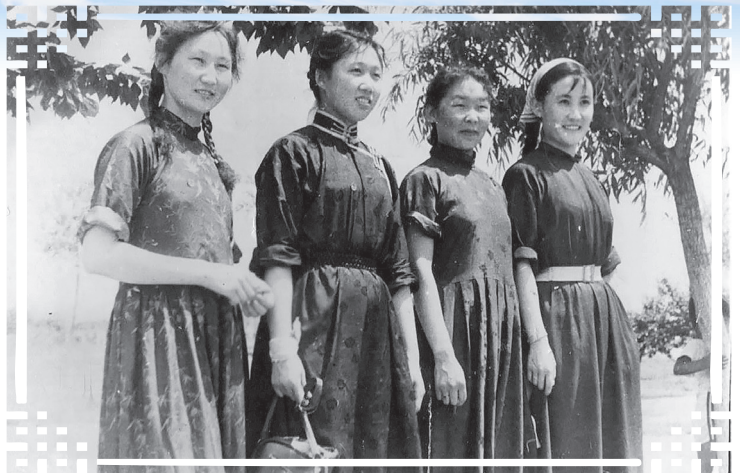
Хамта нүхэд басагадтайгаа. Чичигаар хотодо