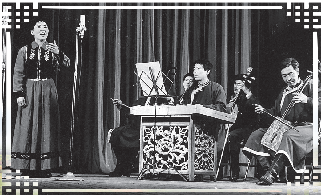
1981 ондо концертын үедэ, Харбиинда