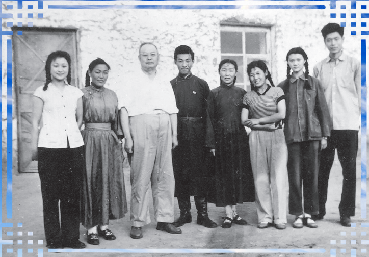
Маршал Еэжиинтэй, 1960 ондо Хүлэн Бүртэ