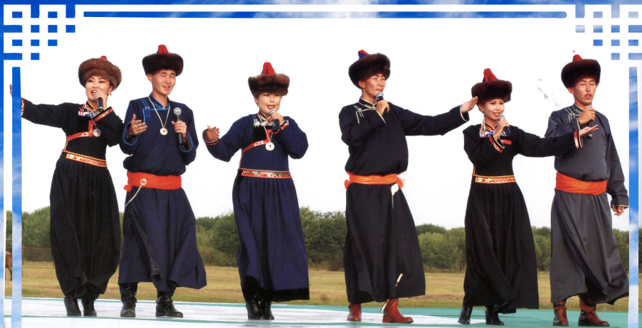
Урлиг соёлдо дура бахатай Ургаж байгаа залуушуул