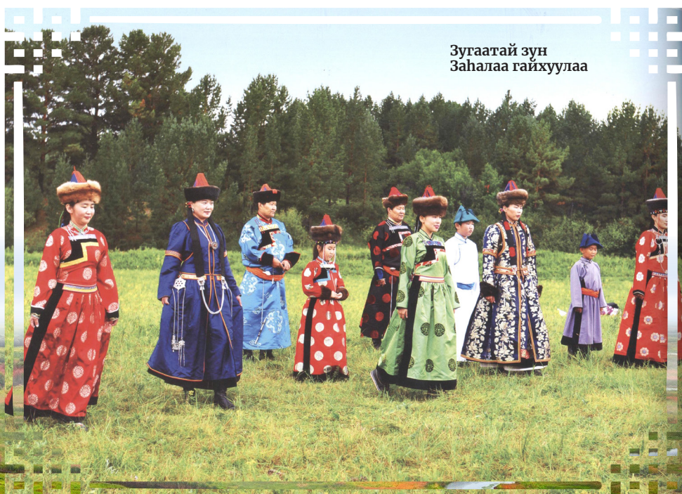
Зугаатай зүн Залалаа гайхуулаа