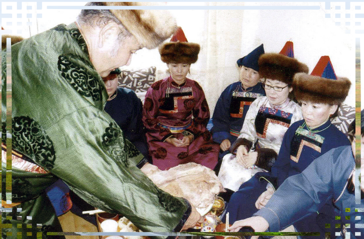
Дуушан Нашан хониной ууса табижа байна