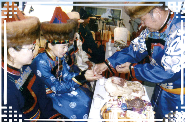
Хадамда ошохо басагаанай наадам