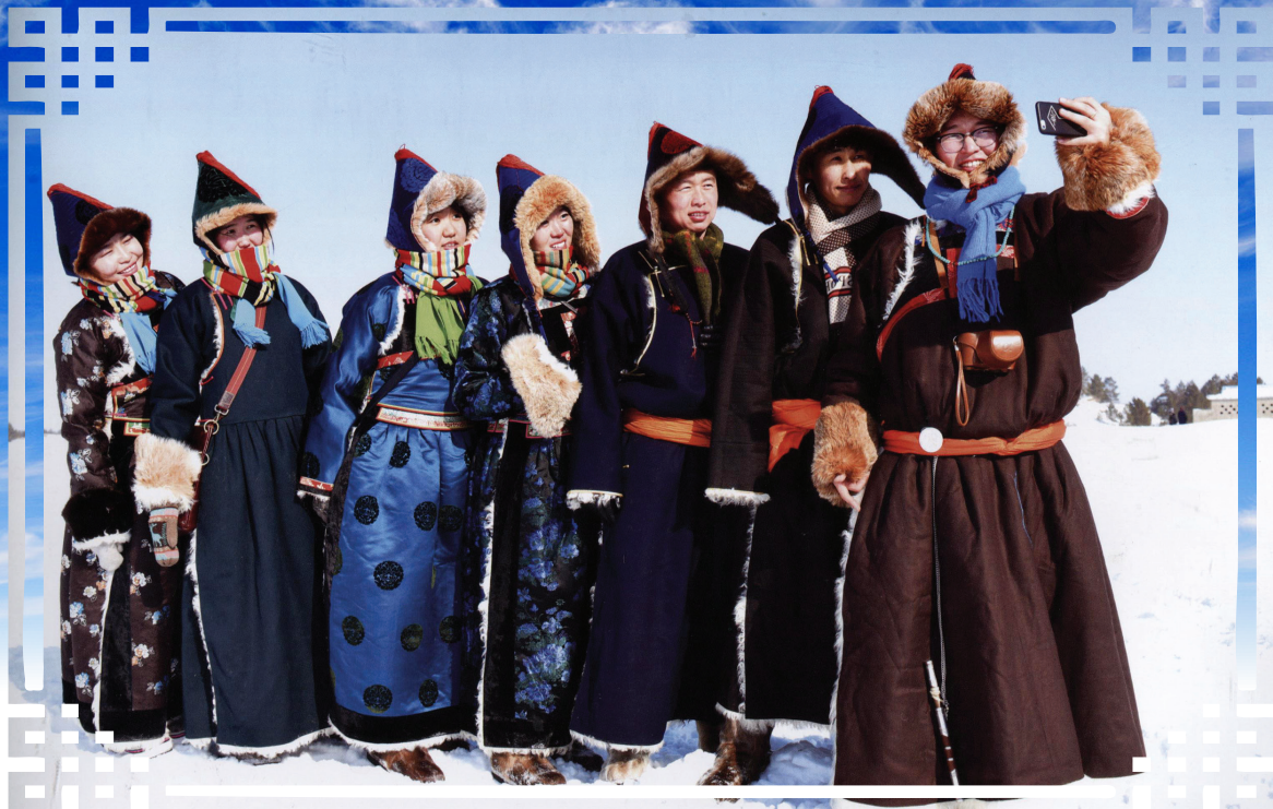
Сагаалганай үедэ. Шэнэхээнэй залуушуул