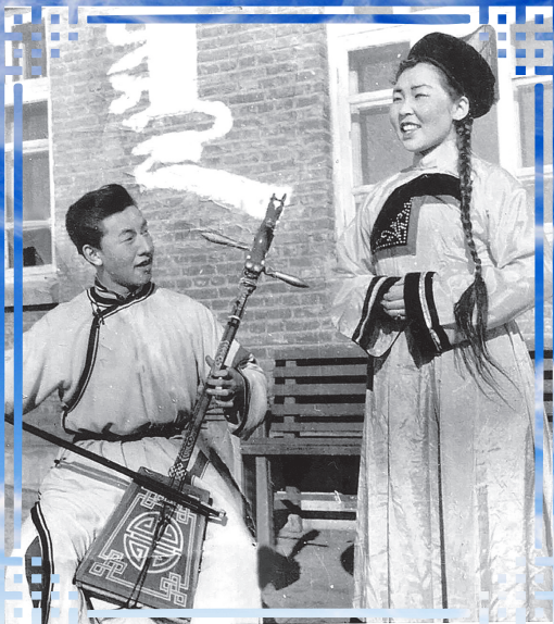
Алдарта дуушан Нумаа, алдарта хүгжэмшэн Баяраа хүдөө нютагта тоглолто гаргажа байна. 1961 ондо