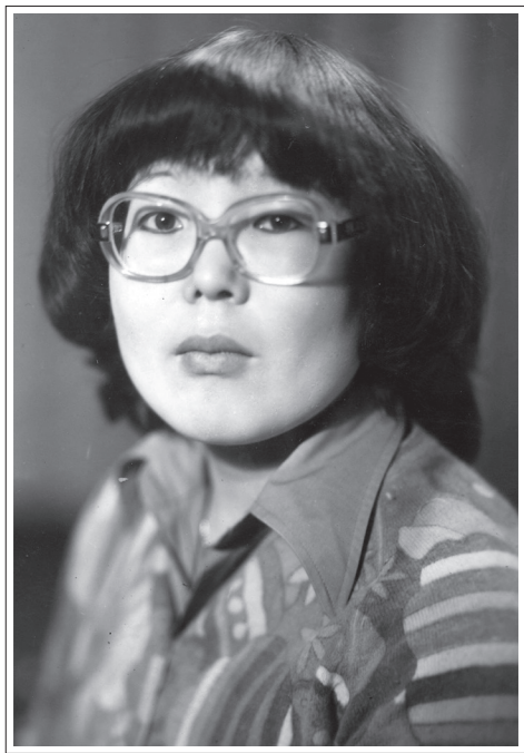
Республика Бурятия, Иволгинский район, с. Оронгой