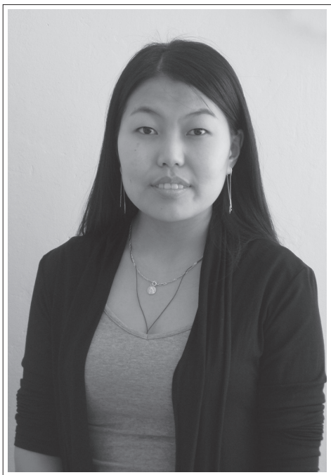
Забайкальский край, Агинский бурятский округ