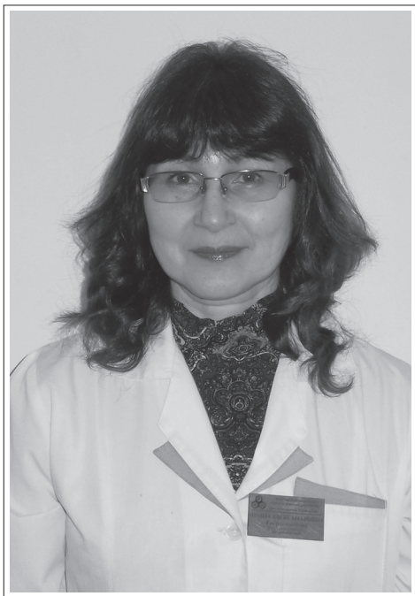
Республика Бурятия, Джидинский район