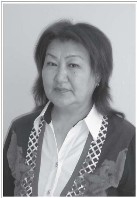
Республика Бурятия, Кижингинский район