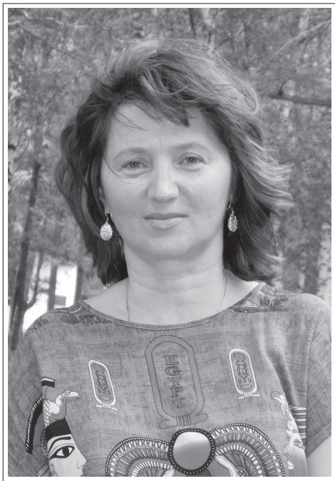
Иркутская область, г. Иркутск