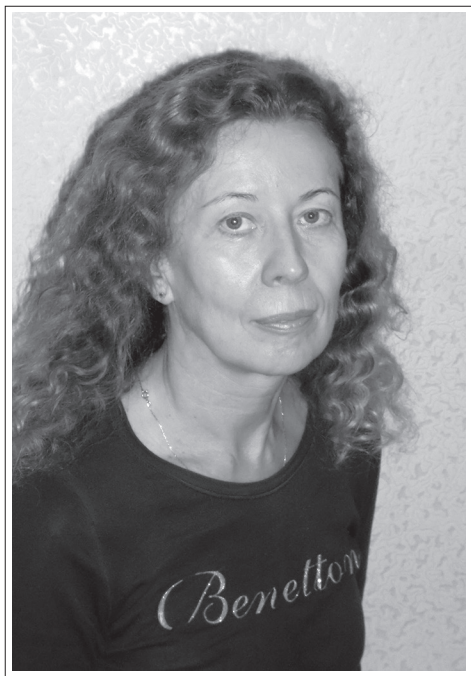
Иркутская область, г. Иркутск