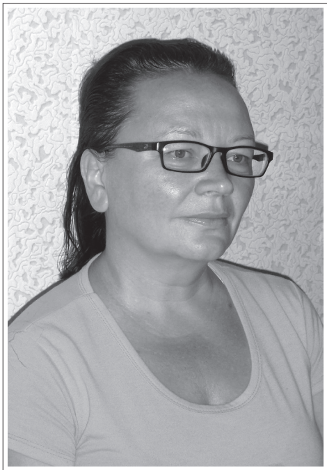
Иркутская область, г. Ангарск