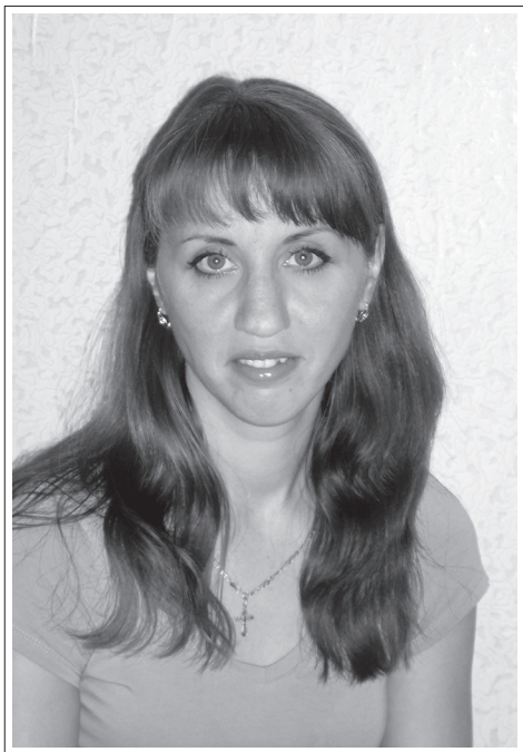
Иркутская область, г. Иркутск