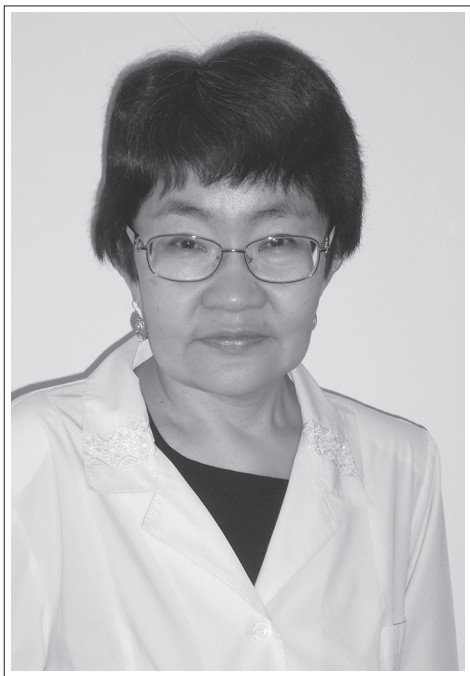
Республика Бурятия, г. Улан-Удэ