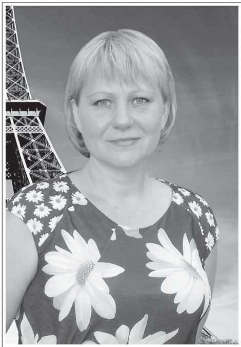
Иркутская область, г. Братск