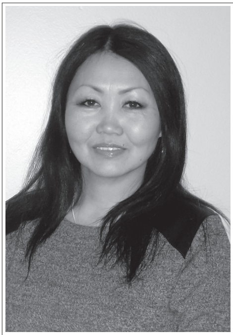
Республика Бурятия, Иволгинский район