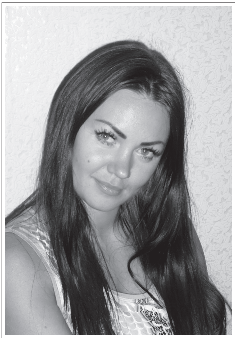
Иркутская область, г. Иркутск