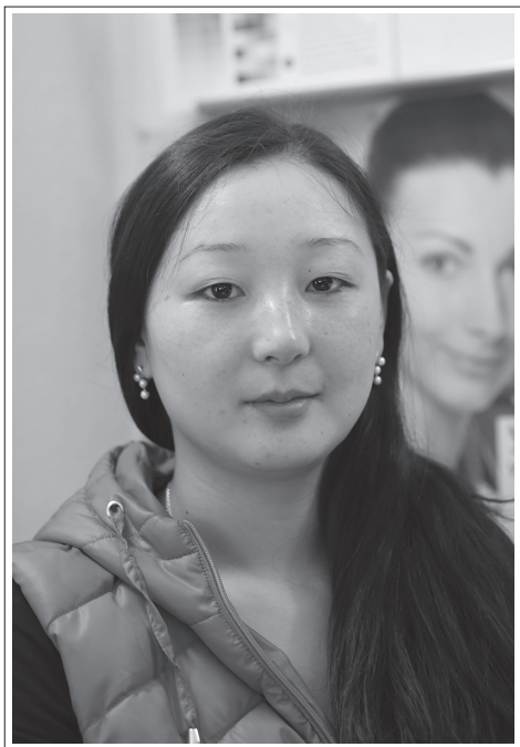
Республика Бурятия, г. Улан-Удэ