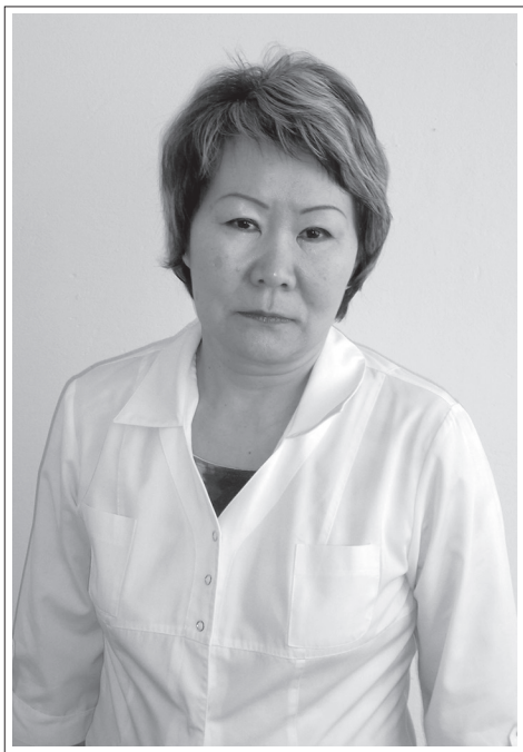
Республика Бурятия, Кижингинский район