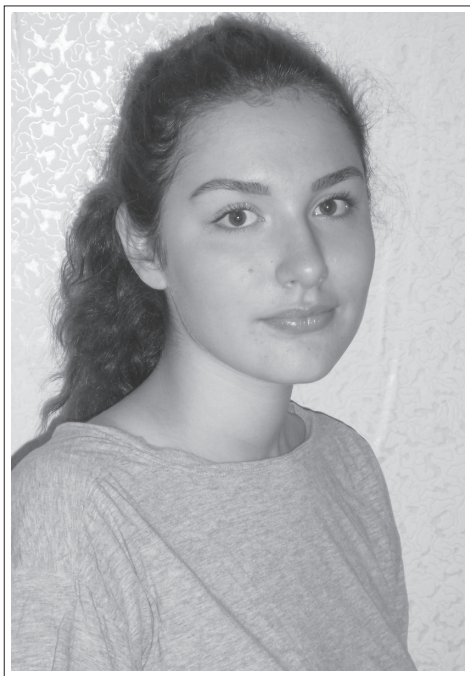
Иркутская область, г. Иркутск