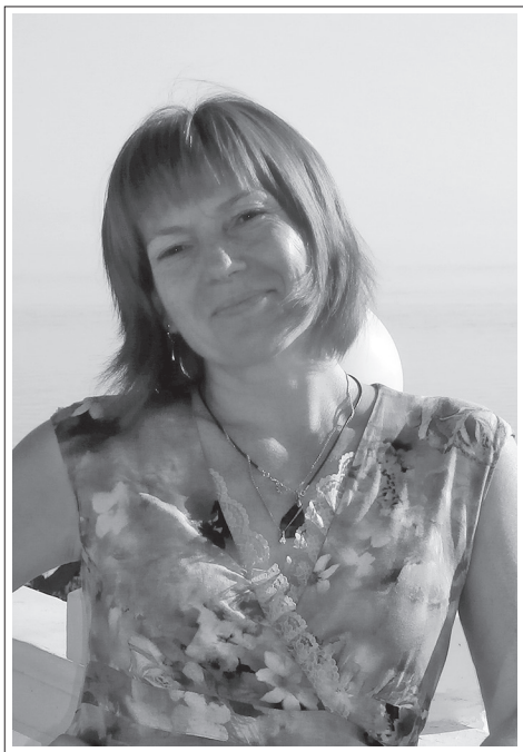
Иркутская область, г. Усть-Илимск